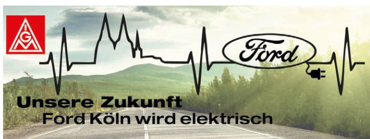
Wir bauen den elektrischen Ford.

Ohne das initiale Engagement der IG Metall-Betriebsräte und -Vertrauensleute wäre dieser Erfolg nicht geglückt. Deshalb danken wir allen, die in den vergangenen zwei Jahren in Arbeitsgruppen und deren Vorbereitung zu dieser Entscheidung beigetragen haben.