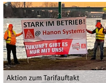
Aktion zum Tarifauftritt

Mit zusätzlichen Fotoaktionen in den Betrieben und einer digitalen Kaffeepause am Weltfrauentag wurden die Forderungen der IG Metall in dieser Tarifrunde untermauert.