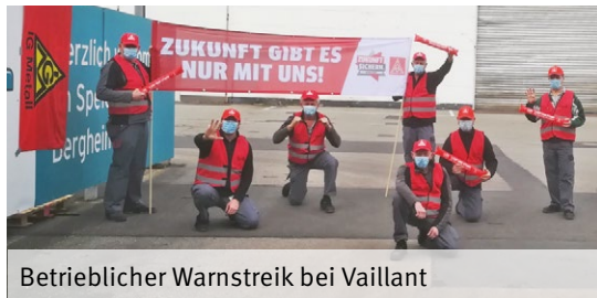
Betrieblicher Warnstreik bei Vaillant